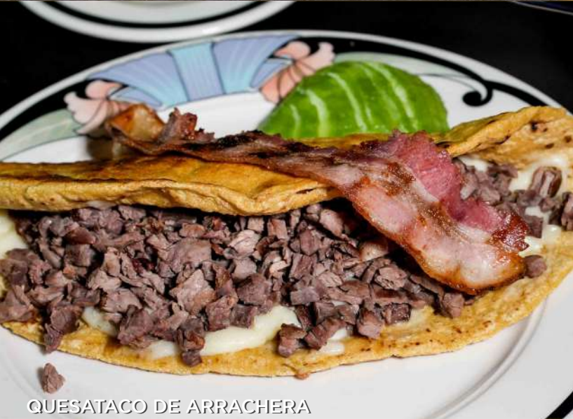
QUESATACO DE ARRACHERA