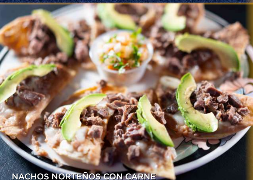
NACHOS NORTEÑOS CON CARNE