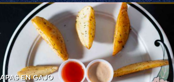
PAPAS EN GAJO