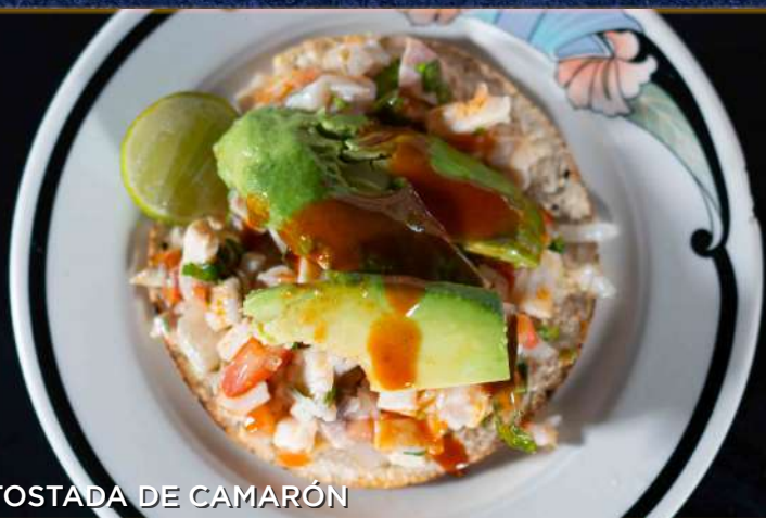
TOSTADA DE CAMARÓN