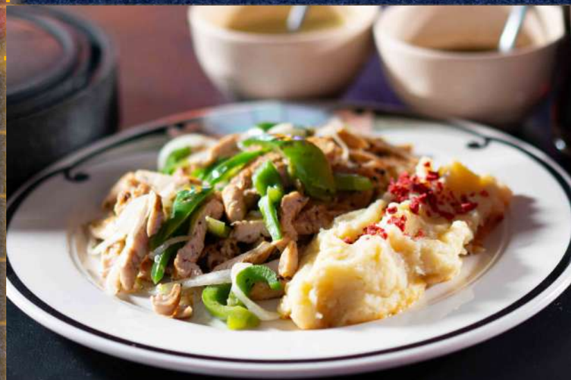
FAJITAS DE POLLO